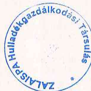
Böjte Sándor Zsolt a Társulási Tanács Elnöke